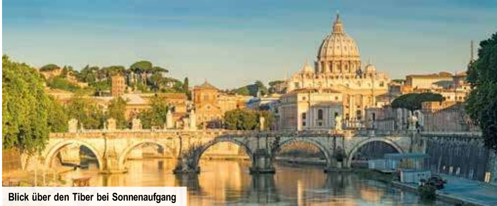
Blick über den Tiber bei Sonnenaufgang

nur mit zeitlich befristetem Aktions-Code