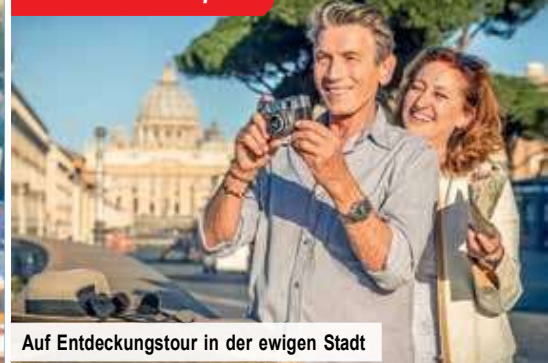
Auf Entdeckungstour in der ewigen Stadt