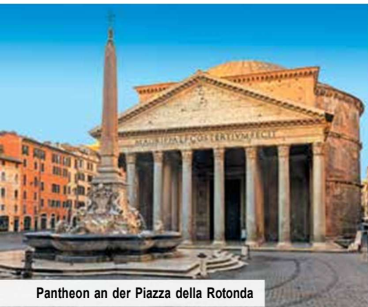
Pantheon an der Piazza della Rotonda