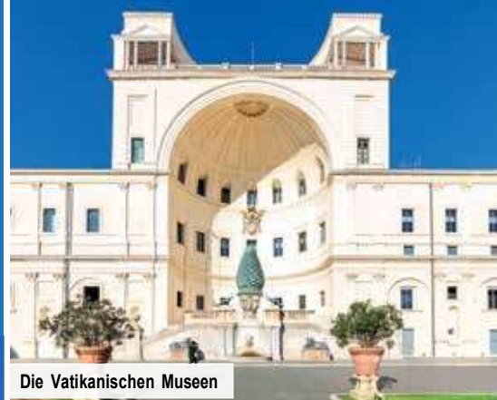
Die Vatikanischen Museen

Änderung der Programmreihenfolge vorbehalten.