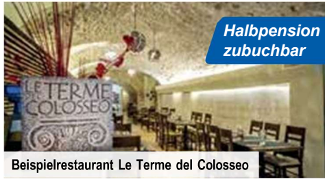
Beispielrestaurant Le Terme del Colosseo