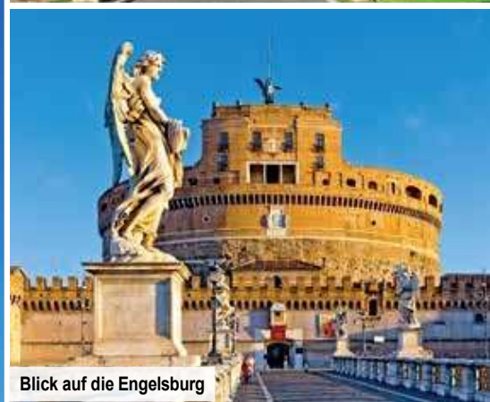
Blick auf die Engelsburg