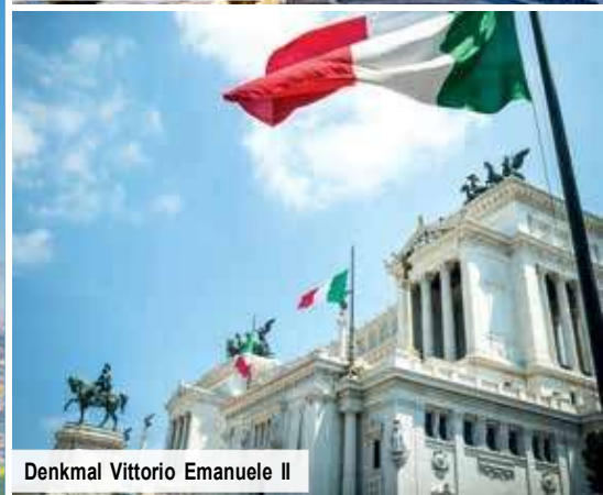
Denkmal Vittorio Emanuele II