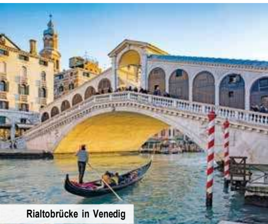
Rialto-Brücke in Venedig

Tag 3: Heute genießen Sie entweder freie Zeit am Meer oder begeben sich mit uns auf einen spannenden Ausflug nach Triest. Die historische Hafenstadt fasziniert mit ihren prächtigen Plätzen und beeindruckenden Bauwerken. Erkunden Sie das pulsierende Zentrum, die lebhaften Märkte und genießen Sie kulinarische Köstlichkeiten in traditionellen Cafés.