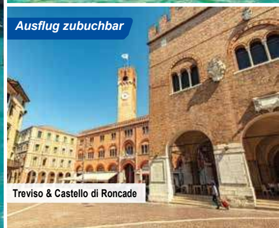
Treviso & Castello di Roncade