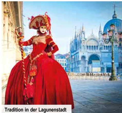
Tradition in der Lagunenstadt