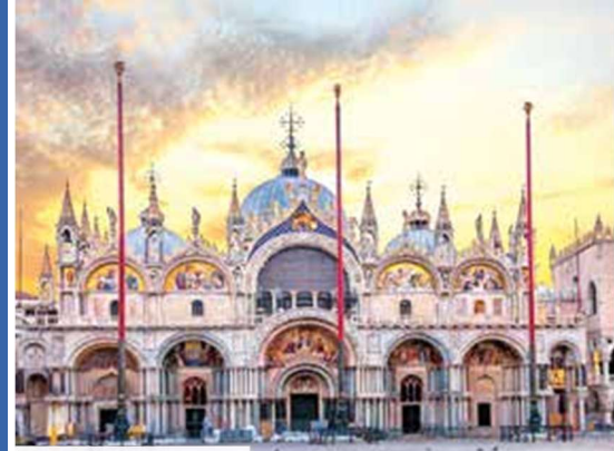
Kathedrale San Marco

Änderung der Programmreihenfolge vorbehalten.