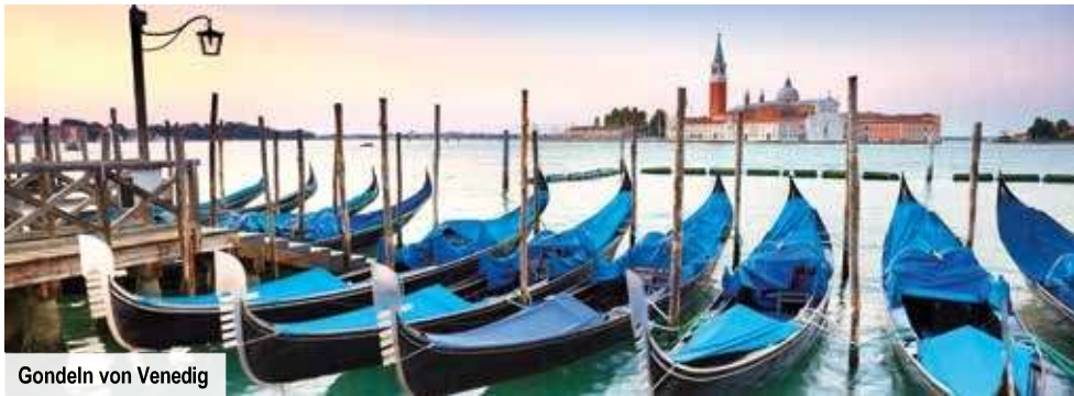
Gondeln von Venedig