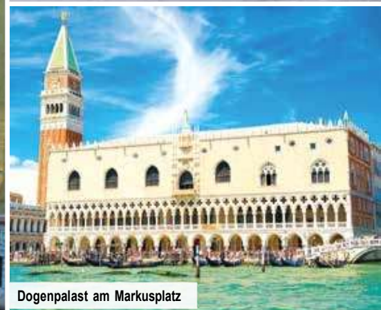
Dogenpalast am Markusplatz