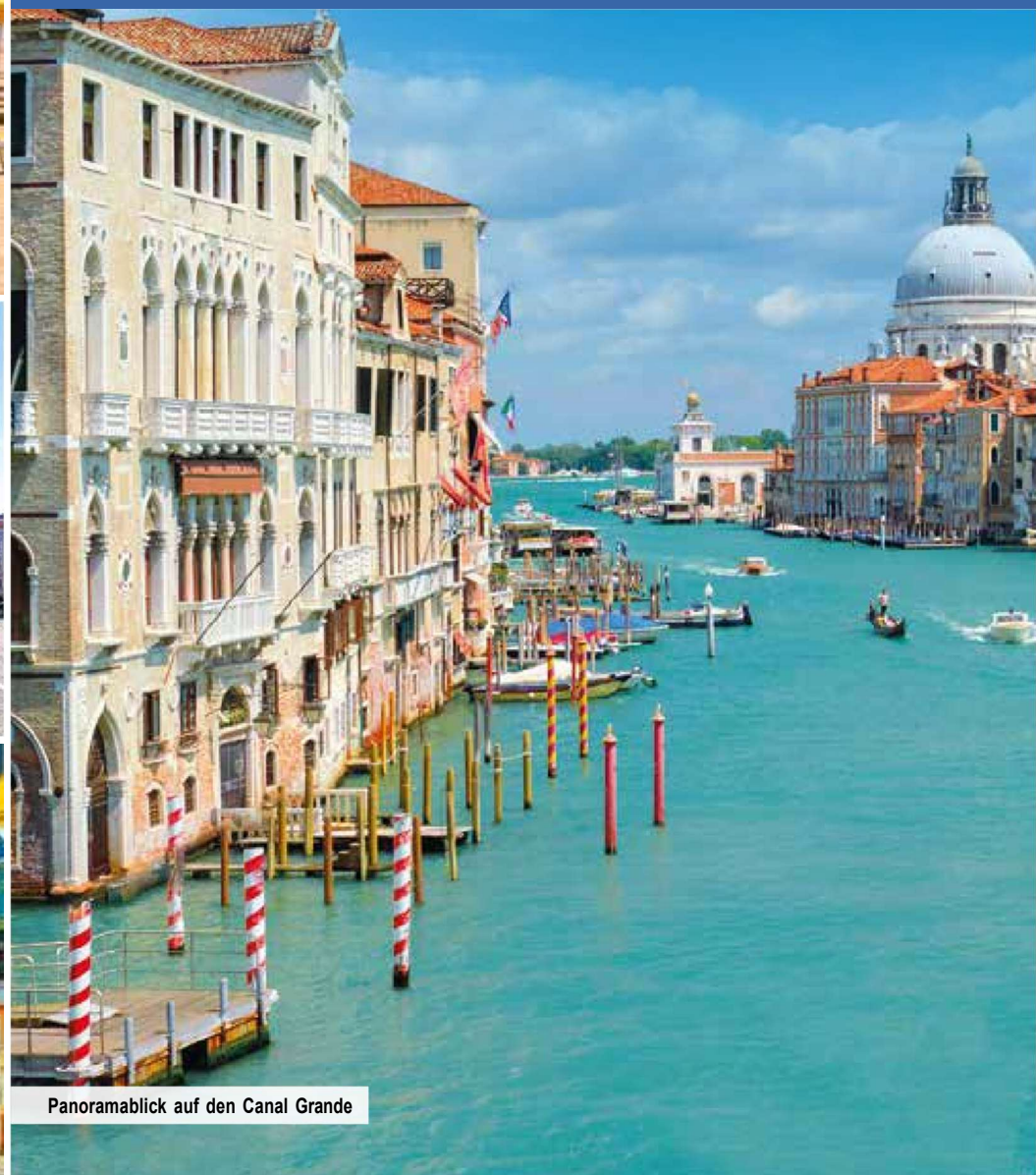
Panoramablick auf den Canal Grande