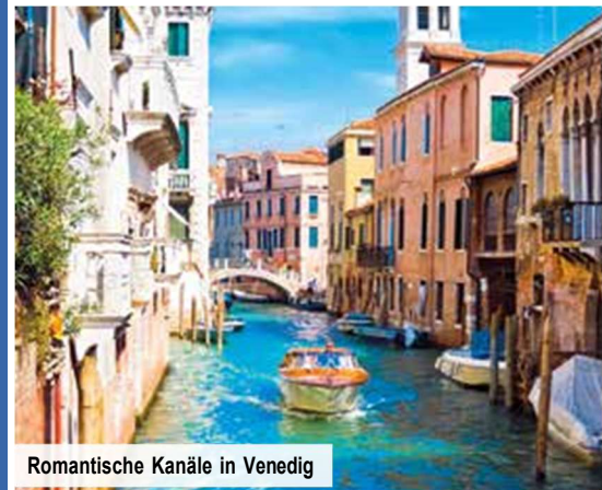
Romantische Kanäle in Venedig