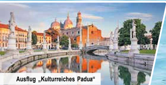
Ausflug „Kulturreiches Padua“