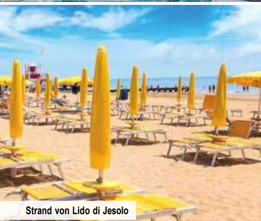
Strand von Lido di Jesolo