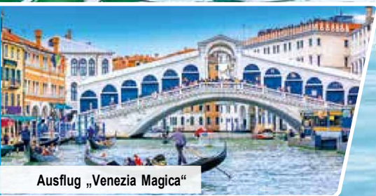
Ausflug „Venezia Magica“

Neu: Ganztagesausflug nach Padua & eine Nacht länger an der Adria Strandnahes Hotel mit Frühstück Stadtbesichtigung von Venedig