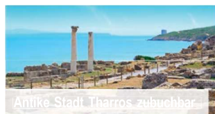
Antike Stadt Tharros zubuchbar

Tag 8: Transfer zum Flughafen und Rückflug nach Deutschland.