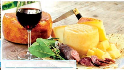
Mittagessen bei einem Schafhirten