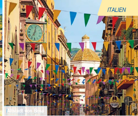
Altstadt von Bosa