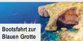
Bootsfahrt zur Blauen Grotte

Buchen Sie drei Ausflüge zum günstigen Paketpreis im Voraus & sparen Sie bis zu € 48 p. P.! Der Halbtagesausflug „Die Dreistadt Malts und eine Hafentrundfahrt im Dghajsa“, der Ganztagesausflug „Tempel, Hafenflair & die Blaue Grotte“ und der Halbtagesausflug „Prunkpalast, Gartenträume & Brauerei-Erlebnis“ werden Sie garantiert begeistern! Nur Vorabbuchung € 189 p. P.