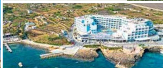
Riviera Spa Resort - Adults Only