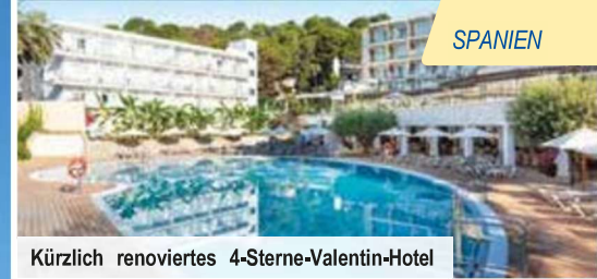
Kürzlich renoviertes 4-Sterne-Valentin-Hotel

Inklusive Ausflugspaket im Wert von € 399, Halbpension Plus & trendtours-Finca-Fest