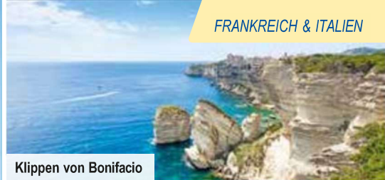
Klippen von Bonifacio