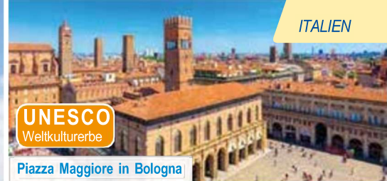
Piazza Maggiore in Bologna