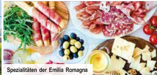
Spezialitäten der Emilia Romagna