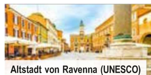
Altstadt von Ravenna (UNESCO)

Bei Vorabbuchung sparen Sie € 10 p. P. € 129 p. P.