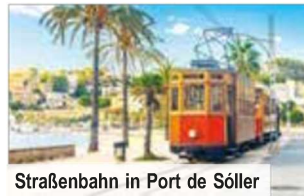
Straßenbahn in Port de Sóller