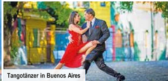
Tangotänzer in Buenos Aires