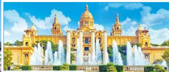
Nationalpalast in Barcelona