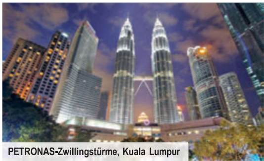
PETRONAS-Zwillingstürme, Kuala Lumpur