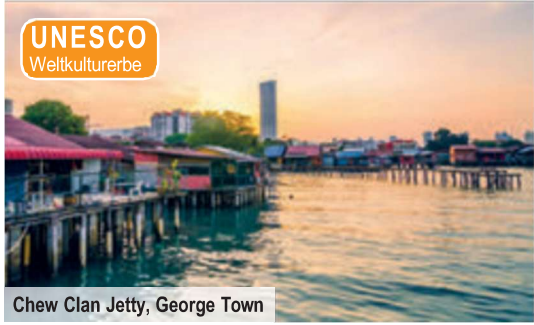
Chew Clan Jetty, George Town