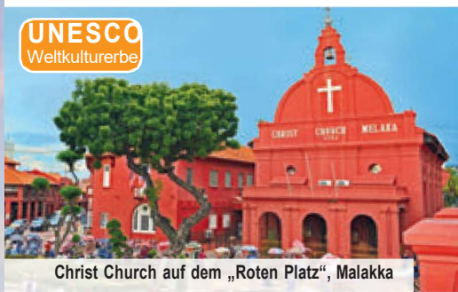
Christ Church auf dem „Roten Platz“, Malakka