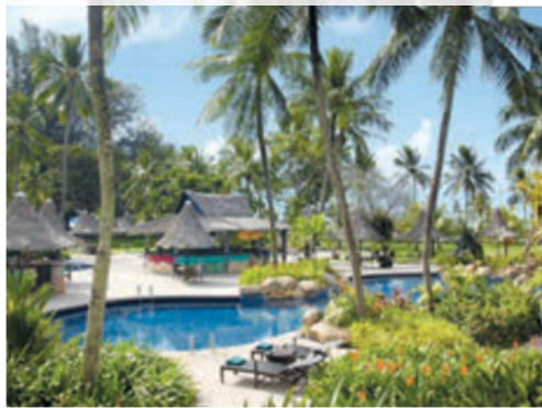
Erholung im Strandhotel auf Penang