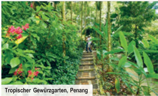
Tropischer Gewürzgarten, Penang

Ihrem Hotel mit einem Steamboat-Dinner verwöhnt, einer Spezialität dieser Region.