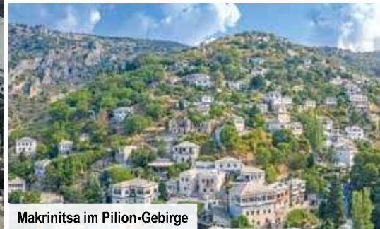
Makrinita im Pilion-Gebirge