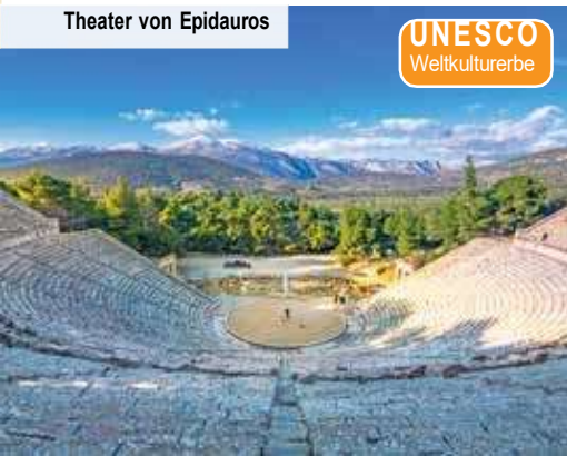
Theater von Epidauros

Rationale Erklärungsansätze leiten gerne die häufige Richtigkeit der Weissagungen davon ab, dass es sich bei Delphi um das kommunikative Zentrum handelte, die