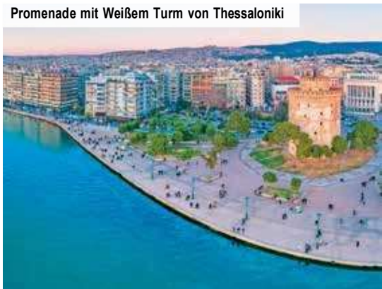
Promenade mit Weißem Turm von Thessaloniki