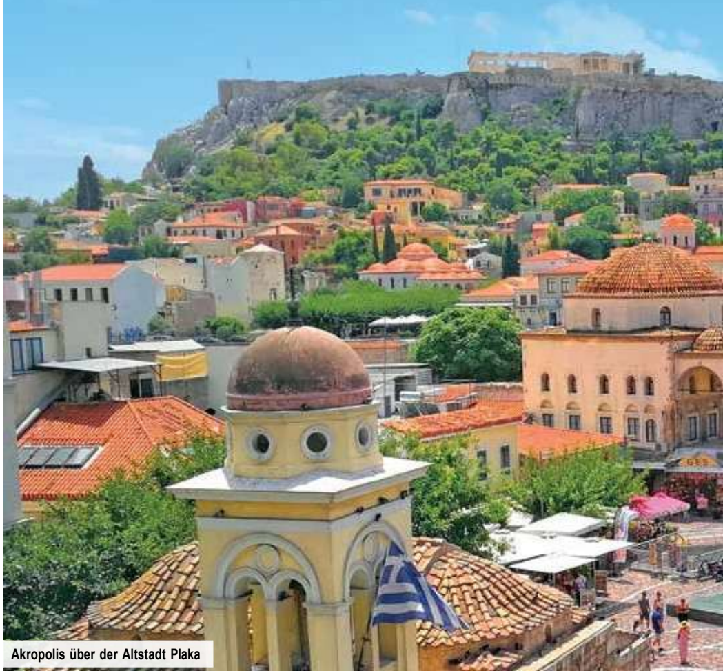
Akropolis über der Altstadt Plaka