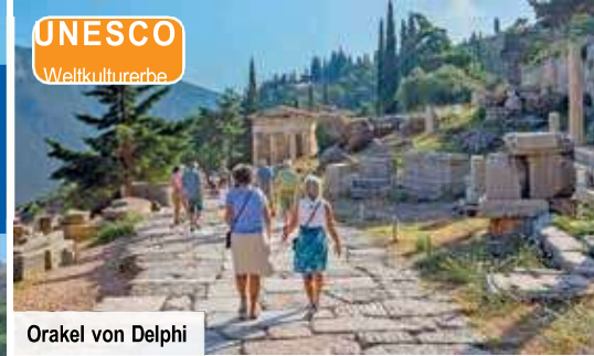
Orakel von Delphi