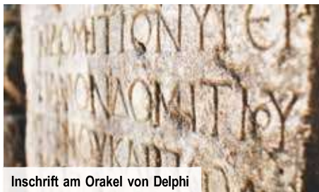
Inschrift am Orakel von Delphi

Priester gut vernetzt waren und sie so manche geschichtliche Wendung vorhersehen konnten. Ihren Besuch im Museum haben wir bereits inkludiert. Unsere Prophezeiung: Sie werden begeistert sein! Später erreichen Sie Ihr Hotel im Raum Trikala, in dem Sie eine Nacht verbringen werden.