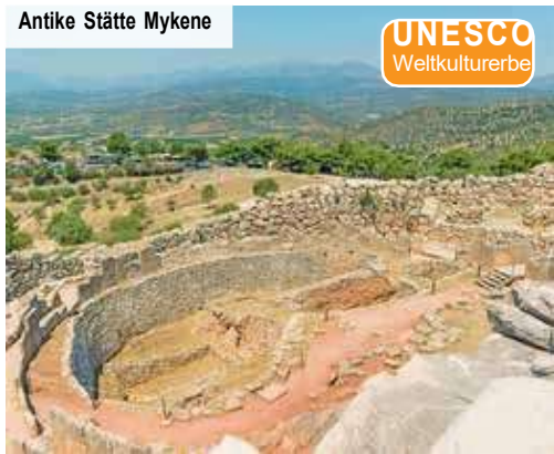
Antike Stätte Mykene