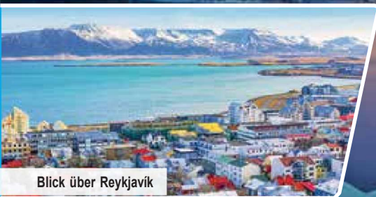
Blick über Reykjavik

Ausflugs- & Erlebnisprogramm mit 3 Ausflügen & Nordlichterjagd Exklusiver Willkommensabend mit Opernsängern Halbpension