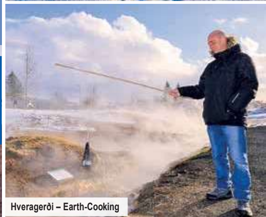
Hveragerði – Earth-Cooking