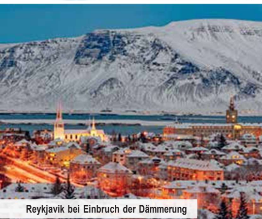
Reykjavik bei Einbruch der Dämmerung