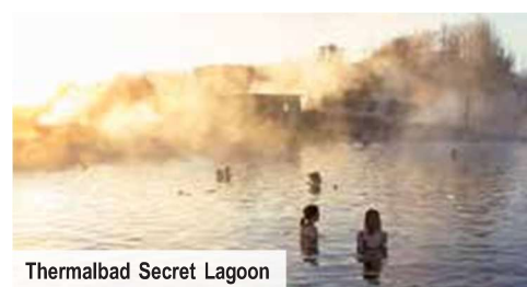
Thermalbad Secret Lagoon