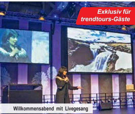
Willkommensabend mit Livegesang

Auf dieser Reise haben wir für Sie bereits ein abwechslungsreiches Ausflugs- & Erlebnisprogramm mit isländischen Spezialitäten kombiniert. Sie besichtigen Islands Hauptstadt Reykjavik und besuchen die Ausstellung Wonders of Iceland sowie das Perlan-Planetarium mit seiner sagenhaften Nordlichter-Show. Sie erkunden den atemberaubenden Nationalpark Thingvellir (UNESCO-