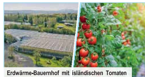
Erdwärme-Bauernhof mit isländischen Tomaten

Ganztagesausflug „Gullfoss – der Goldene Wasserfall – und das Springquellengebiet der Geysire“ Besuch des Gullfoss-Wasserfalls, des Springquellengebietes mit Großem Geysir und Strokkur-Geysir, der Gewächshäuser von Friðheimar inklusive „Tomaten-Lunchbuffet“ und Kennenlernen der berühmten Isländpferde sowie Eintritt in den ältesten Naturpool Islands, die Secret Lagoon € 149 p. P. Bei Vorabbuchung sparen Sie € 20 p. P. € 129 p. P. In der Kleingruppe € 219 p. P. Bei Vorabbuchung sparen Sie € 20 p. P. € 199 p. P.