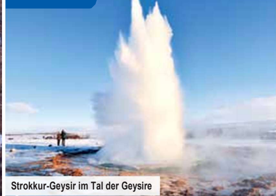
Strokkur-Geysir im Tal der Geysire