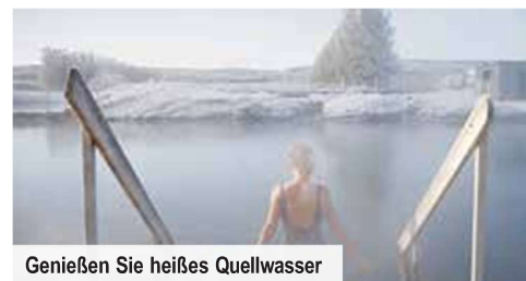
Genießen Sie heißes Quellwasser