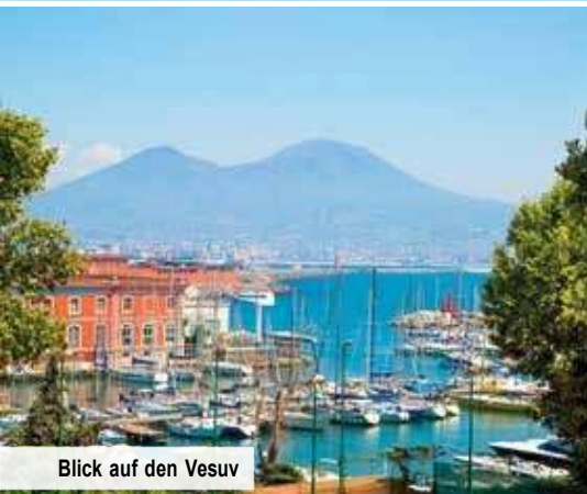
Blick auf den Vesuv