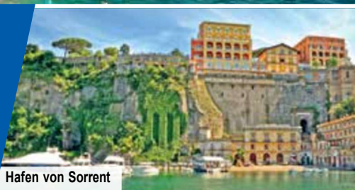
Hafen von Sorrent

Besonderes Highlight: Schiffsfahrt entlang der Amalfiküste