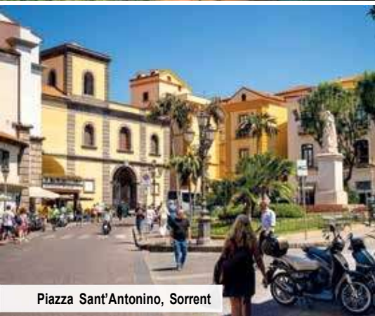
Piazza Sant'Antonino, Sorrent