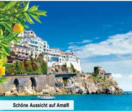
Schöne Aussicht auf Amalfi

... wer kommt da nicht schon zu Hause ins Träumen? Amalfi, Sorrent, Bella Napoli, Pompeji und Salerno – die berühmten Orte an der ebenso berühmten Amalfiküste wecken das Fernweh nach Italien! trendtours hat für Sie die Höhepunkte dieser Traumküste in einer einzigartigen 8-tägigen Reise kombiniert. Freuen Sie sich auf atemberaubende Ausblicke auf die wildromantische Steilküste, weltberühmte Sehenswürdigkeiten und weite Sandstrände zum Sonnen, Schwimmen und Entspannen.