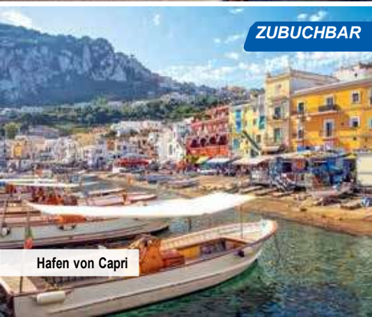
Hafen von Capri

Tag 1: Die farbenfrohe Amalfiküste gehört mit ihren postkartenreifen Panoramen zu einer der schönsten Küsten Europas und Sie zu den Glücklichen, die sie intensiv bestaunen dürfen! Sie fliegen nach Neapel und werden dort von Ihrer Flughafenassistentin freundlich begrüßt. Ein Transfer bringt Sie bequem zu Ihrem Hotel im Raum Sorrent, wo Sie die erste von drei Übernachtungen genießen.