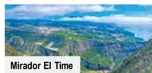
Mirador El Time