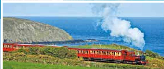
Nostalgische Zugfahrten auf der Isle of Man