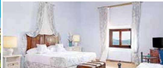
Zwei Nächte in einem romantischen Landgut-Hotel