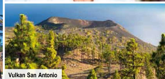
Vulkan San Antonio