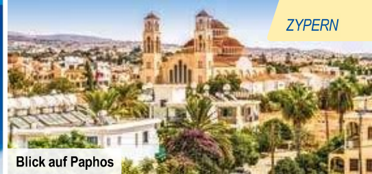
Blick auf Paphos