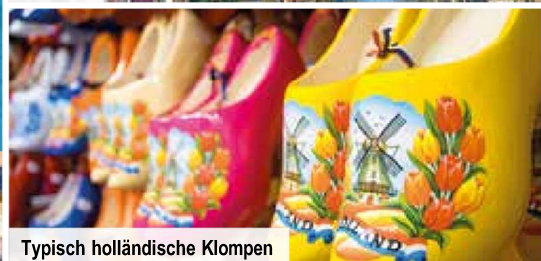
Typisch holländische Klompen