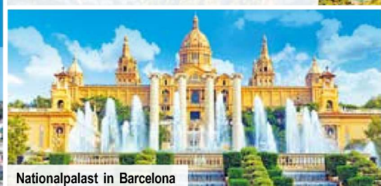
Nationalpalast in Barcelona