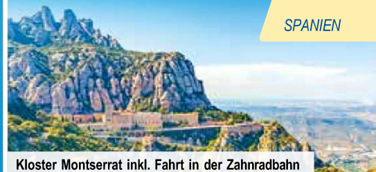
Kloster Montserrat inkl. Fahrt in der Zahnradbahn

Alle verfügbaren Reisetexte & Flughäfen finden Sie auf trendtours.de