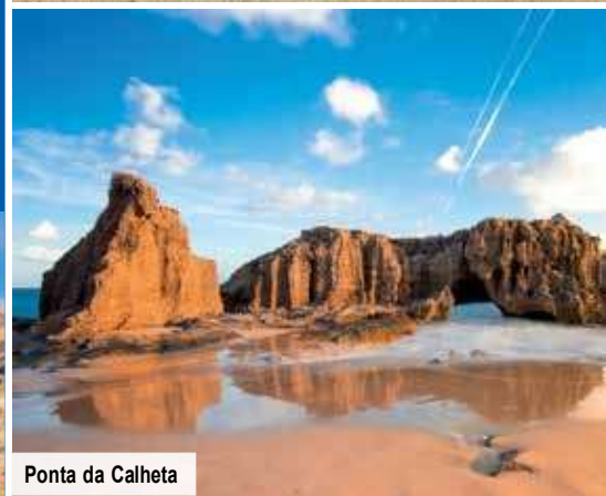
Ponta da Calheta