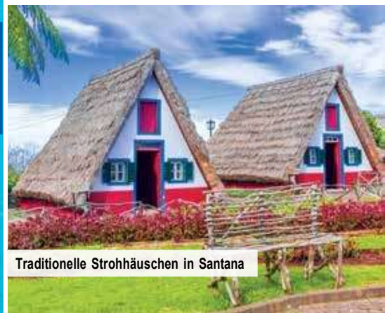
Traditionelle Strohhäuschen in Santana