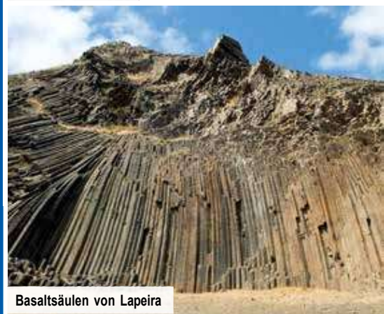
Basaltsäulen von Lapeira