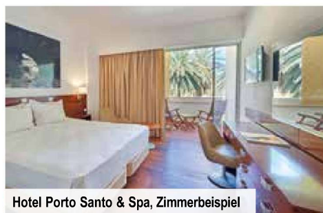
Hotel Porto Santo & Spa, Zimmerbeispiel