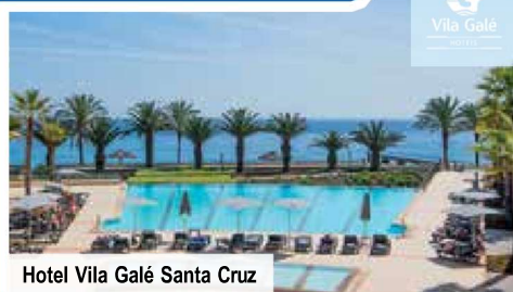
Hotel Vila Galé Santa Cruz