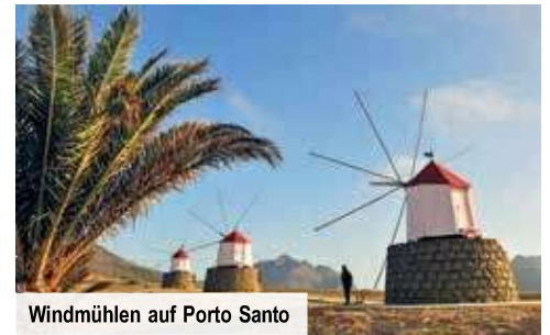
Windmühlen auf Porto Santo