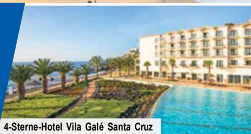
4-Sterne-Hotel Vila Galé Santa Cruz

Zwei Trauminseln auf einer Reise mit 4-Sterne-Hotels & Halbpension Ausflugsprogramm mit u. a. Santana, Madeirawein-Probe, Levada- Wanderung & Inselrundfahrt auf Porto Santo