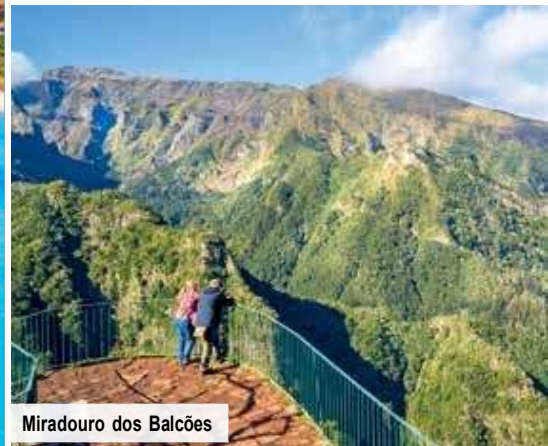
Miradouro dos Balcões