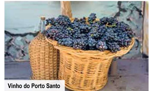
Vinho do Porto Santo