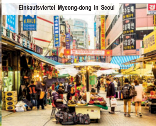
Einkaufsviertel Myeong-dong in Seoul

Heute fahren Sie in den Gayasan-Nationalpark. Hier bestaunen Sie den Haeinsa-Tempel, der UNESCO-Welterbe ist und bis heute aktiv als Kloster genutzt wird. Hier lagern mehr als 80.000 hölzerne Druck-