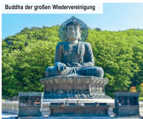
Buddha der großen Wiedervereinigung