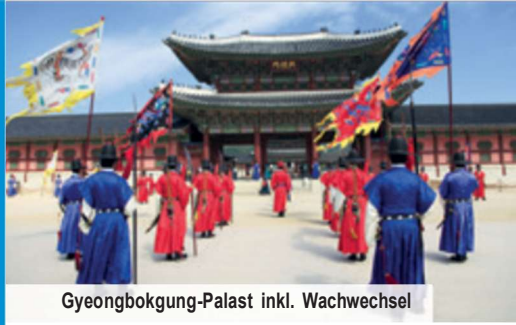
Gyeongbokgung-Palast inkl. Wachwechsel