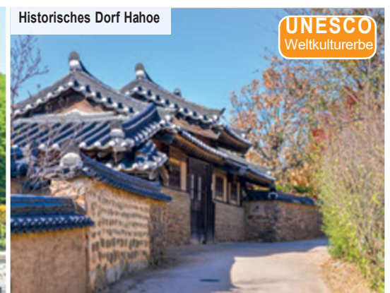
Historisches Dorf Hahoe