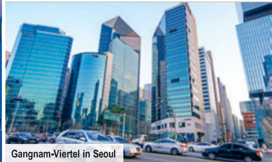
Gangnam-Viertel in Seoul

platten der sogenannten Tripitaka Koreana! Nach freier Zeit am Mittag geht es zum Hügelgräberpark (UNESCO). Im Anschluss sehen Sie auch die Cheomsongdae-Sternwarte, das älteste Observatorium Asiens, und den Donggung-Palast sowie dessen Teichanlage. Abends Fahrt zum Hotel in Gyeongju, wo Sie für 2 Nächte einchecken.