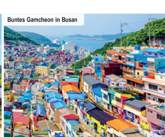
Buntes Gamcheon in Busan