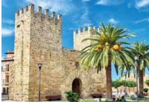
Porta del Moll in Alcúdia