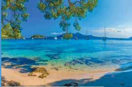
Karibikgefühl am Strand von Formentor