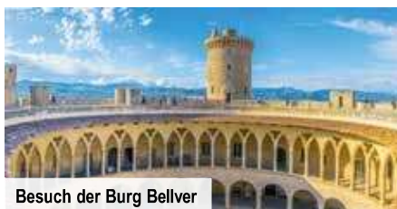
Besuch der Burg Bellver