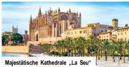
Majestätische Kathedrale „La Seu“