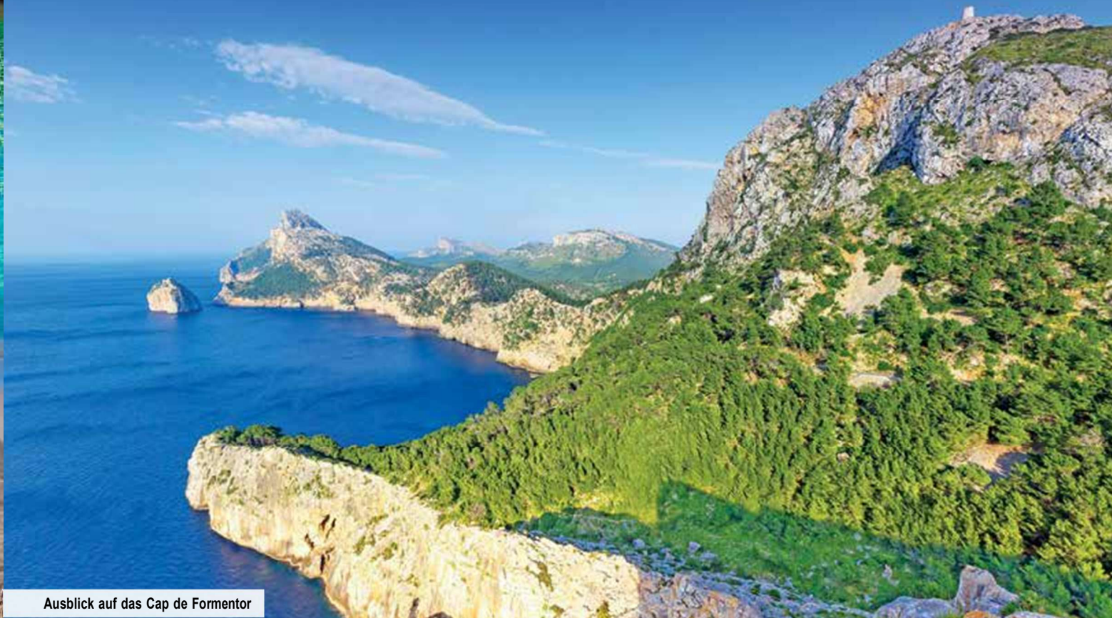
Ausblick auf das Cap de Formentor

Zu guter Letzt entdecken Sie eine überraschende Seite der sonst so lieblichen Insel: Vom Aussichtspunkt Mirador Es Colomer schweift Ihr Blick über das windgepeitschte Cap de Formentor und seine raue, urwüchsige Schönheit – ein weiterer besonderer Moment, den Sie auf ewig in Erinnerung behalten werden!