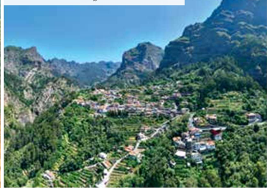
Blick ins Nonntal „Curral das Freiras“