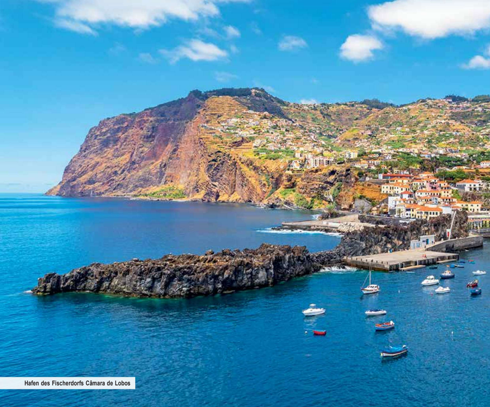
Hafen des Fischerdorfs Câmara de Lobos