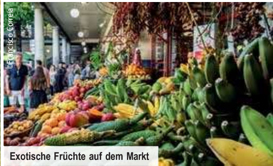
Exotische Früchte auf dem Markt