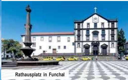
Rathausplatz in Funchal