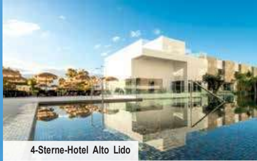
4-Sterne-Hotel Alto Lido