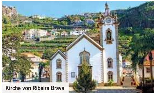
Kirche von Ribeira Brava