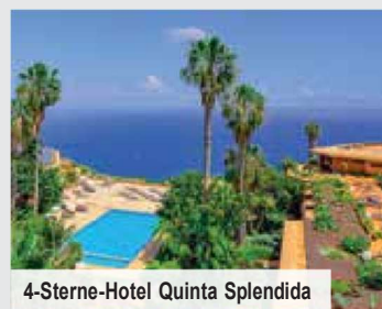
4-Sterne-Hotel Quinta Splendida

Das 4-Sterne-Hotel Quinta Splendida mit Herrenhaus-Flair, das inmitten eines wunderschönen Gartens liegt, wird Sie genauso begeistern, wie das 5-Sterne-Hotel Vidamar , das Sie unter anderem mit direktem Meereszugang und komfortablen Zimmern mit Meerblick verückt. Während das Quinta Splendida in Caniço liegt, befindet sich das Vidamar in Funchal.