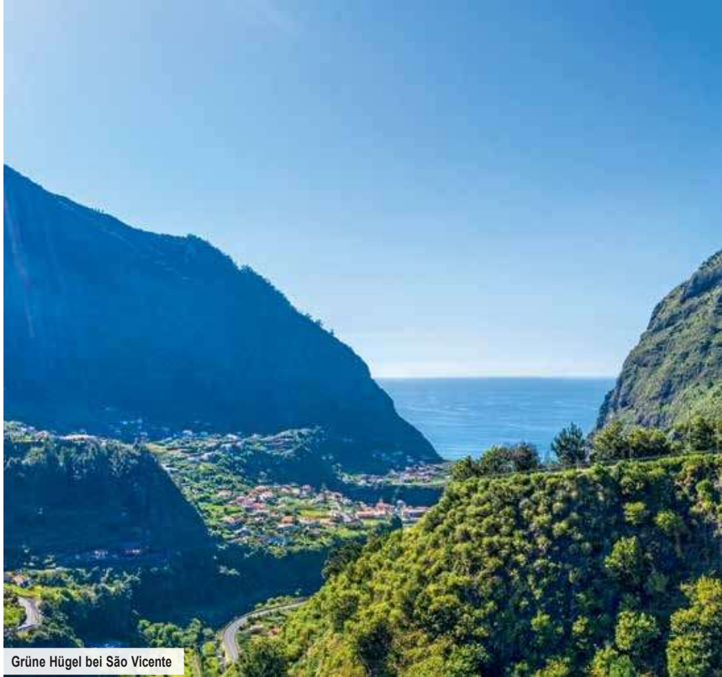
Grüne Hügel bei São Vicente