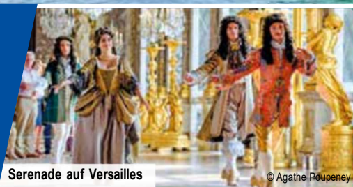
Serenade auf Versailles

Besuch von Schloss Versailles mit der Serenade