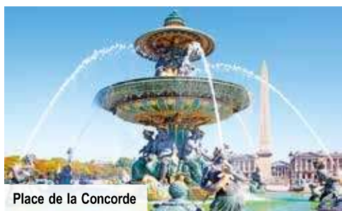
Place de la Concorde