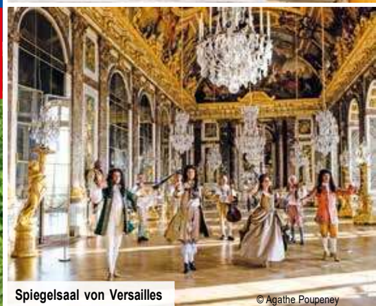
Spiegelsaal von Versailles