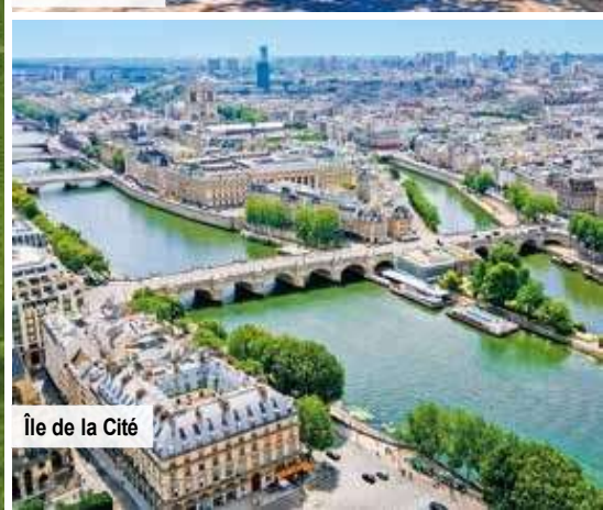
Île de la Cité