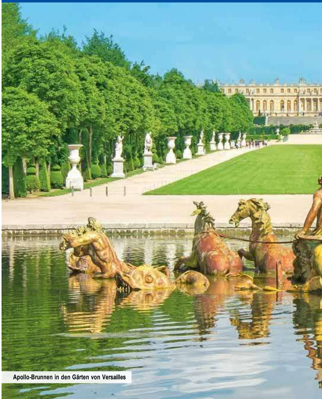
Apollo-Brunnen in den Gärten von Versailles

Hier erwartet Sie die Serenade, bei der Sie auf die schönste vorstellbare Art in die glanzreiche Zeit des Sonnenkönigs katapultiert werden: Zu herrlichen Barockklängen schreiten Sie durch die prunkvollen Räumlichkeiten des luxuriösen Schlosses – natürlich nicht durch alle, denn es sind in etwa 1.300! Dabei erleben Sie historische Gesangs-, Theater- sowie Tanzaufführungen und die eindrucksvollsten Räume wie den Spiegelsaal oder die Schlachtengalerie. Um in den Genuss solch feiner Kunst und prachtvoller Architektur zu kommen, mussten Sie früher ein Marquis, Chevalier oder eine Grande Dame sein.