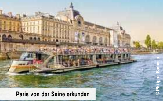
Paris von der Seine erkunden