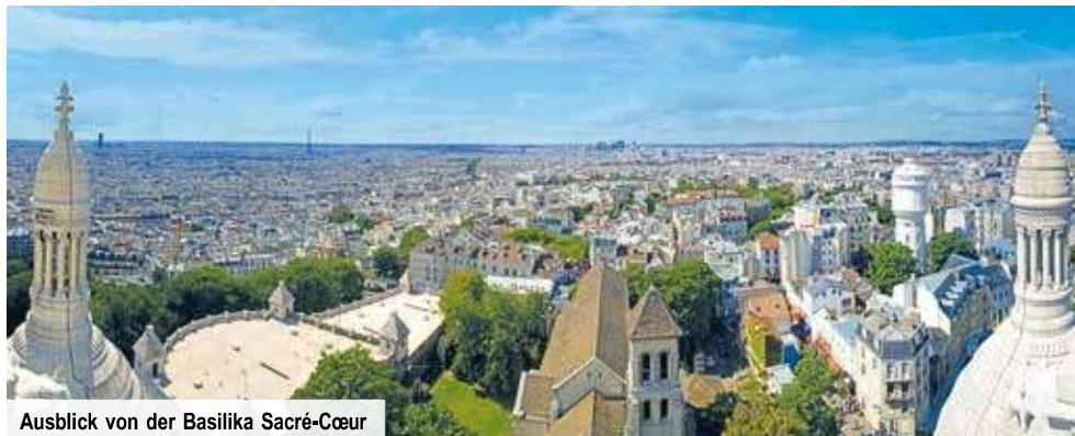
Ausblick von der Basilika Sacré-Coeur